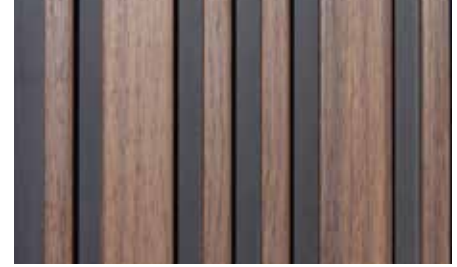
A46 Parota Black