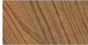
A42 Walnut Veteado / Cepillado