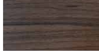
A01 Nogal Matte