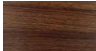
A02 Nogal Natural