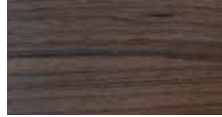
A01 Nogal Matte