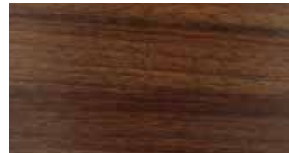
A02 Nogal Natural